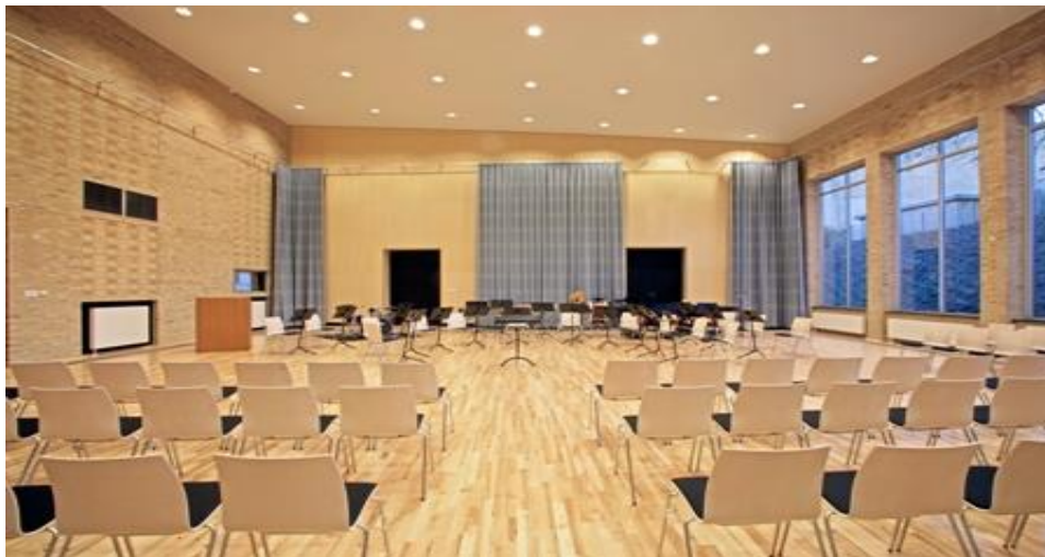
Sal med fleksibel akustik i form af gardiner (Slesvigske musikhus)

Efter Gazzværkets åbning er den rytmiske scene godt hjulpet i forhold til koncertvirksomhed, men de klassiske orkestre og kor, som er nævnt ovenfor, lider i den grad under mangel på egnet koncertsted. Mange af dem afholder derfor størstedelen af deres koncerter uden for kommunens grænser på trods af at de øver og føler sig hjemhørende i Aabenraa.