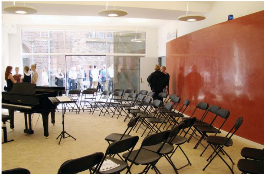
Sal indrettet til sang (Haderslev)

Evt. administrationsfaciliteter (Aabenraa Live eller andre)