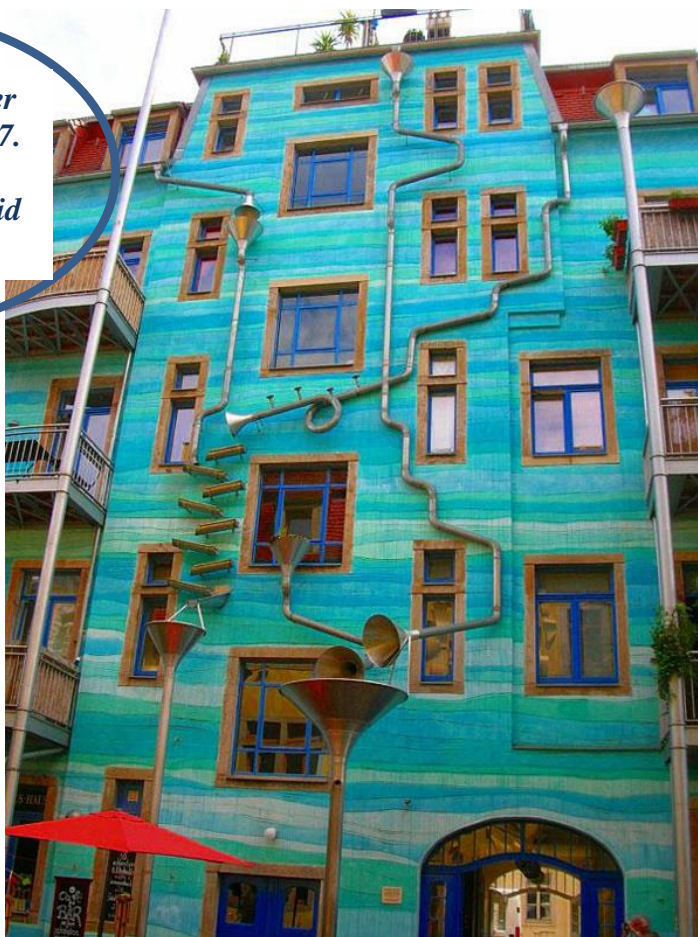
Musik på facaden på et hus i Dresden

Der er i dag aktiviteter på musikområdet 24/7. Musikaktiviteter sker både i skole/ arbejdstid og i fritiden