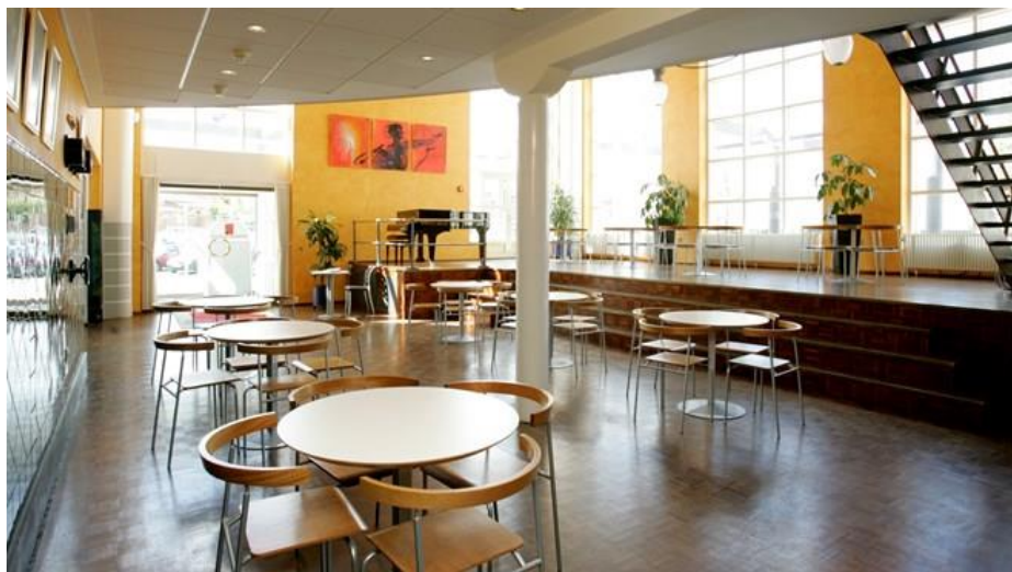
Her supplerer foyeren store sal og lille sal som koncertegnet område (Slagelse)

Ved større arrangementer – orkesterstævner, koncerter m.m. vil det være nødvendigt med garderobe gerne koblet til et opholdsområde for både musikere og publikum. Det er i øvrigt her de hjemhørende orkestre mødes i pauser og udvikler ideer og netværker.